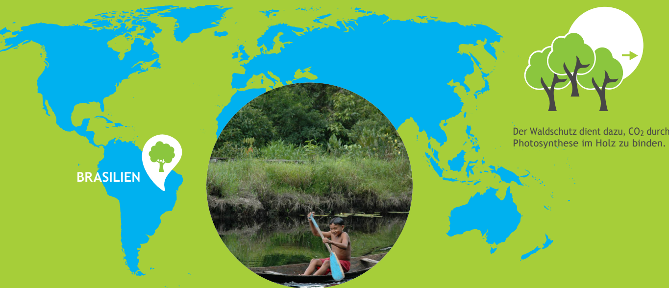
Der Waldschutz dient dazu, CO 2 durch Photosynthese im Holz zu binden.

Der Wald, der seit Jahrhunderten als Holzlieferant begehrt ist, ist inzwischen auch zu einem wichtigen Aspekt in der Klimaschutzdebatte geworden. Böden und Pflanzen nehmen jährlich zwischen drei und vier Milliarden Tonnen Kohlenstoff aus der Atmosphäre auf. Gleichzeitig setzt die Abholzung von Wäldern große Mengen CO 2 frei. Da der Mensch darüber hinaus noch mehr Emissionen verursacht, reicht das vorhandene Waldvorkommen nicht aus, um alle CO 2 -Emissionen zu binden. Nur etwa ein Viertel wird durch die Vegetation ausgeglichen. Es ist also von großer Bedeutung, die vorhandenen Wälder zu schützen.